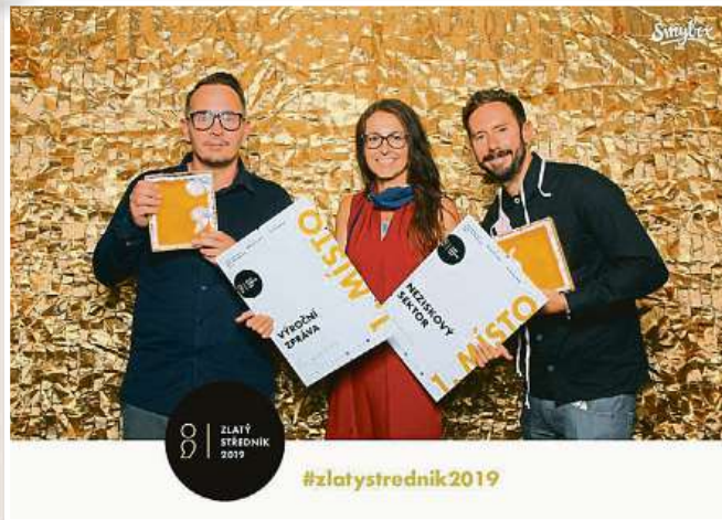
Ocenění Zlatý středník v podobě dvou zlatých medailí za výroční zprávu Nadace „Atlas kouzelných bytostí z Křišťálového údolí“