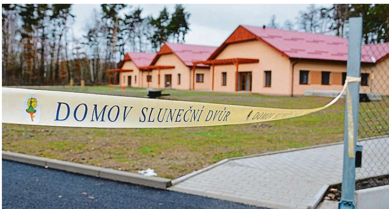
LEPŠÍ ZÁZEMÍ DOMOV SLUNEČNÍ DVŮR SE NACHÁZÍ V KLIDNÉ ČÁSTI JESTŘEBÍ U ŽELEZNIČNÍ STANICE POBLÍŽ LESA.

Mentálně hendikepované ženy se z ústavního prostředí přestěhovaly do tří nových bezbariérových domů v Jestřebí. Budou mít větší soukromí.