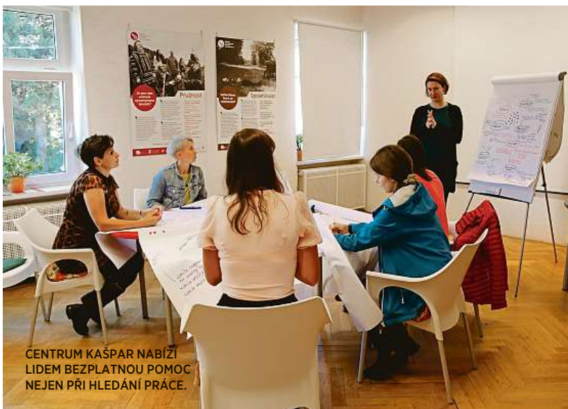
CENTRUM KAŠPAR NABÍŽÍ LIDEM BEZPLATNOU POMOČ NEJEN PŘI HLEDÁNÍ PRÁCE.