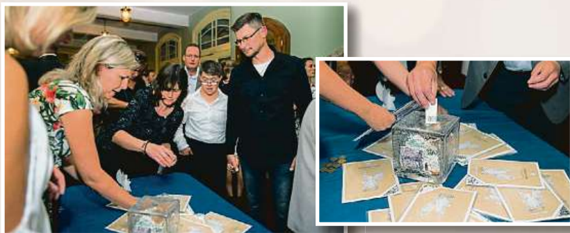
Sbírka Nadace Preciosa