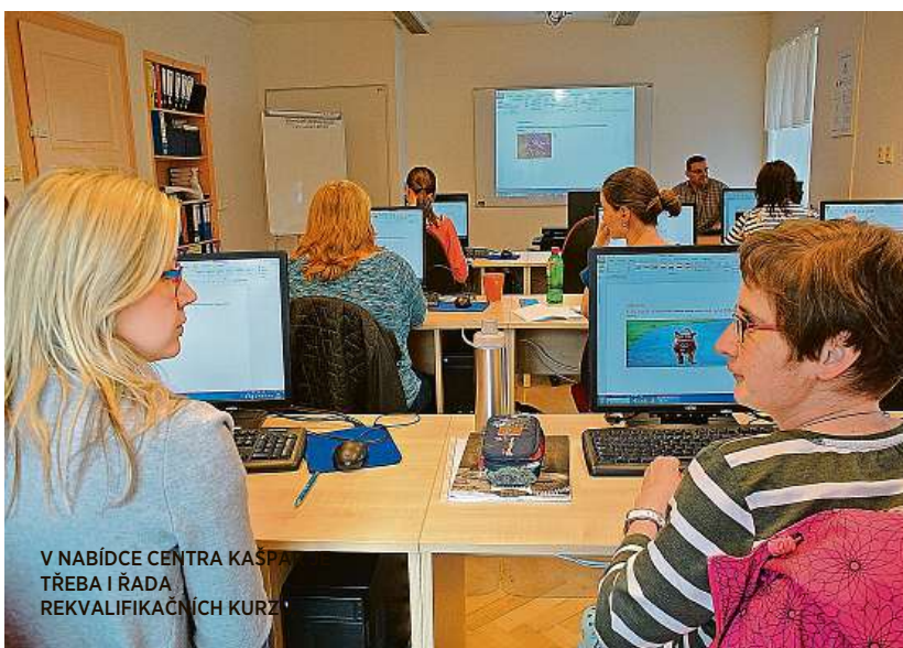
V NABÍDCE CENTRA KAŠPAR TŘEBA I ŘADA REKVALIFIKAČNÍCH KURZŮ