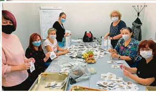
Naši dobrovolníci navlékají náramky