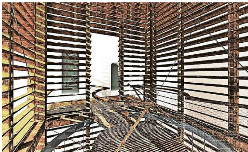
ZÁCHRANA OBNOVA KOSTELA NANEBEVZETÍ PANNY MARIE JE HISTORICKY NEJVĚTŠÍ PROJEKT NADACE. NA VIZUALIZACI JE NÁVRH NOVÉHO PŘÍSTUPU DO VĚŽE OD MARTINA RAJNIŠE.

to tak nebude. A tak do doby, než dostaneme stavební povolení, přemýšlíme, jak by mohli přispět i ti, kdo nemají tolik peněz, aby si koupili schod. Samozřejmě také požádáme o pomoc kraj nebo město, abychom v momentě, až budeme mít v ruce stavební povolení, měli dostatek financí a mohli s pracemi začít.