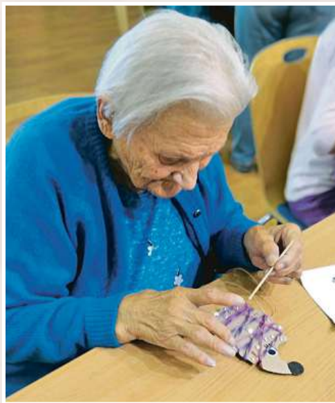
Křišťálové tvoření pomáhá seniorům realizuje nadace s dobrovolníky v nemocnicích a domovech pro seniory v celém kraji.