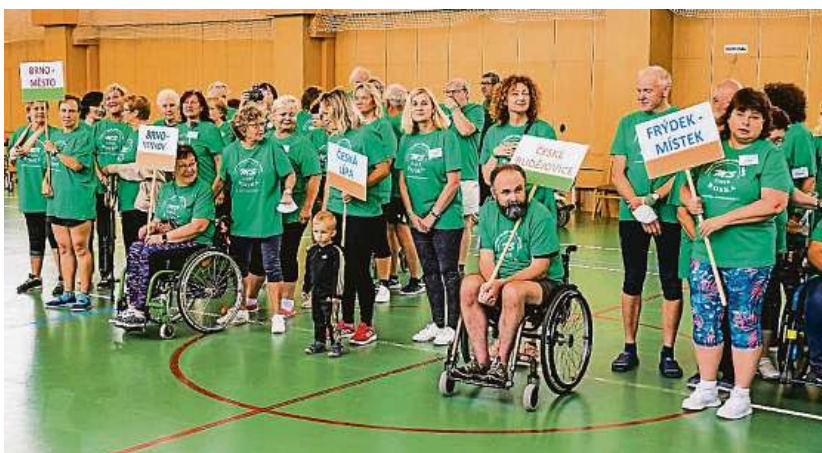
OSVĚTA ROSKA ORGANIZUJE KULTURNÍ A SPORTOVNÍ AKCE, REKONDIČNÍ OZDRAVNÉ POBYTY, PŘEDNÁŠKY NEBO SEZNAMUJE VEŘEJNOST S PROBLEMATIKOU ROZTROUŠENÉ SKLERÓZY.

A co je u liberecké Rosky za poslední čas nového? „Tento rok jsme naše tradiční rekondice pojali trochu jinak a spíš jsme místo jedné dlouhé udělali dvě kratší. A ukázalo se, že tento koncept měl velký úspěch. Oba pobyty probíhaly v září 2021 v Hejnickém klášteře, kam se vždy rádi vracíme. Každý den začínal v sedm hodin rozcvičkou, následovala sní-