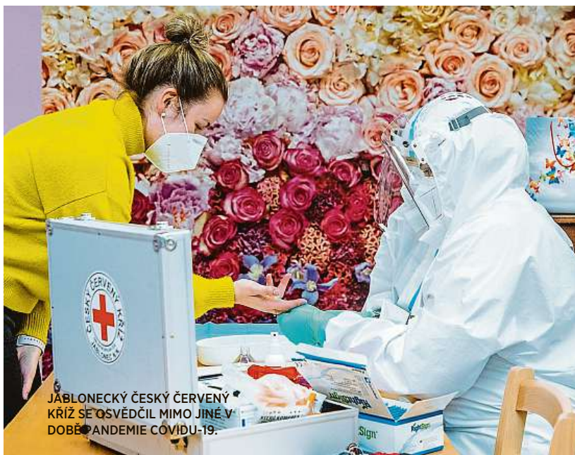
JABLONECKÝ ČESKÝ ČERVENÝ KŘÍŽ SE OSVĚDČIL MIMO JINÉ V DOBĚ PANDEMIE COVIDU-19.