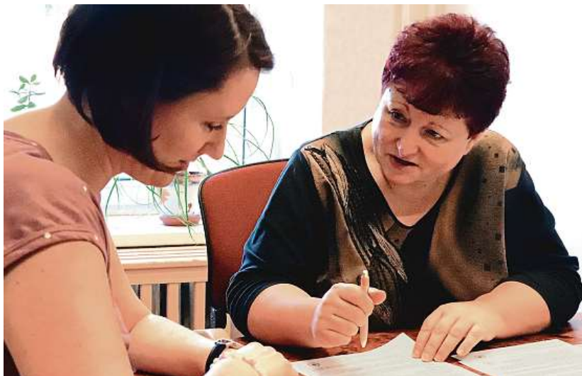
POMÁHAJÍ UPLATNIT SE PORADKYNĚ CENTRA KAŠPAR POMÁHAJÍ KAŽDÝ VŠEDNÍ DEN BEZPLATNĚ VŠEM, KTEŘÍ PORADENSTVÍ POTŘEBUJÍ. NEZÁLEŽÍ NA VĚKU ANI NA TYPU PROFESE.

nou organizací v Libereckém kraji, kterou při řešení zaměstnanosti zajímají perspektivy všech zúčastněných a hledá neotřelá řešení v oblasti zaměstnání, výchovy a vzdělání, sladění profese a soukromí.