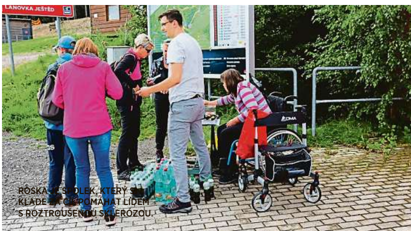
ROSKA JE SPOLEK, KTERÝ SI KLADĚ ZA CÍL POMÁHAT LIDEM S ROZTROUŠENOU SKLERÓZOU.

daně, zdravotní cvičení, relaxace a odborná přednáška na nejpálčivější témata, která trápí lidi s RS. Ve 12 hodin jsme se posílili obědem, po obědě bylo osobní volno, odpoledne probíhalo zdravotní cvičení. Po večeri jsme si užívali večer s různými hrami. Celkově jsme si to moc užili a byli jsme rádi, že jsme se zase po tak dlouhé době viděli,“ uvádějí jednu z aktivit loňského roku webové stránky organizace.