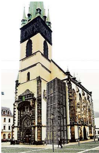
VIZUALIZACE PROJEKTU NA ZPŘÍSTUPNĚNÍ TZV. „ŠIKMÉ VĚŽE“.

Každý rok tak sto až sto dvacet projektů zhruba v částce do dvou a půl milionu korun. Rádi bychom do dvou let částku navýšili na tři a půl milionu korun. Dotkla se nás pandemie koronaviru, kdy se spousta akcí nekonala a ani žadatelé